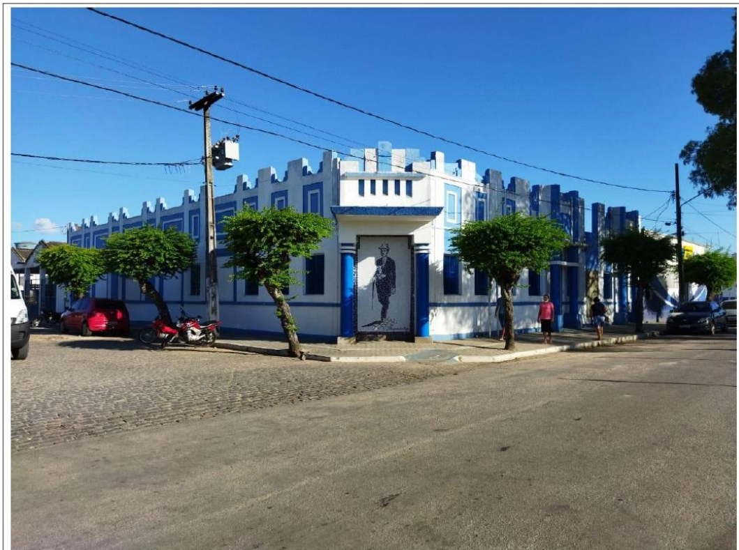
FIG.01 – Frente da Câmara Municipal De Sapé

Foi solicitado um parecer técnico das instalações elétrica interna e externa, tendo em vista os relatos de aquecimento dos cabos por parte do eletricitista que presta serviço a esta casa. Além do prédio ter duas entradas de corrente a qual a concessionaria local (Energisa), não aceita e solicitou padronizar a edificação.